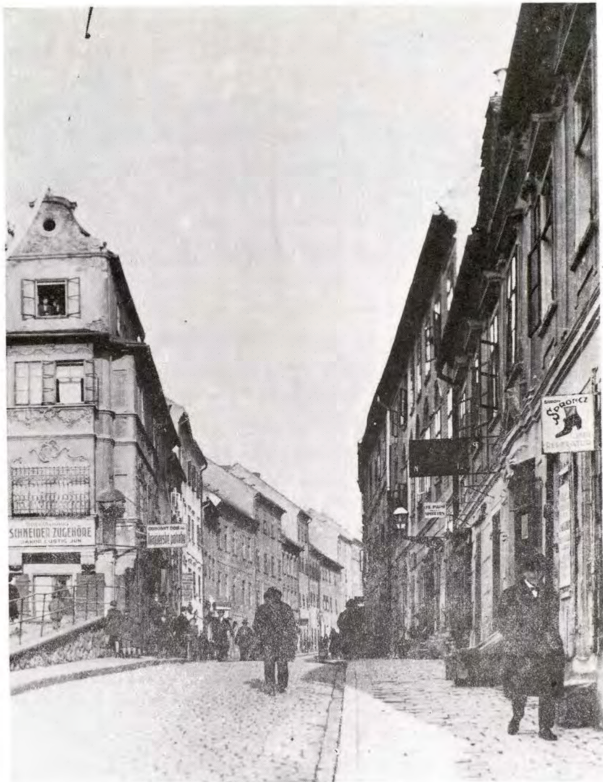
Pohľad na Židovskú ulicu z r. 1927. AMB. Foto J. Hofer. Repro E. Šišková ▲►