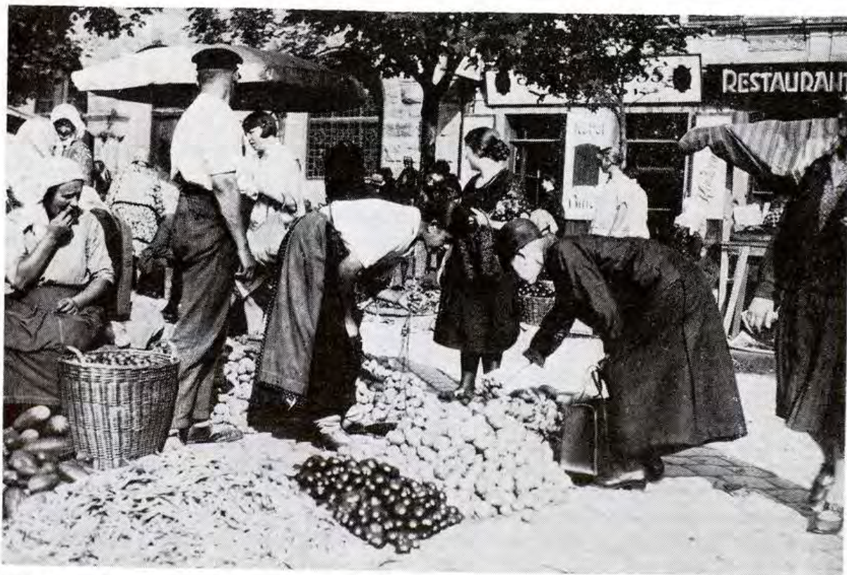
Trh na Rybnom námestí v r. 1930.