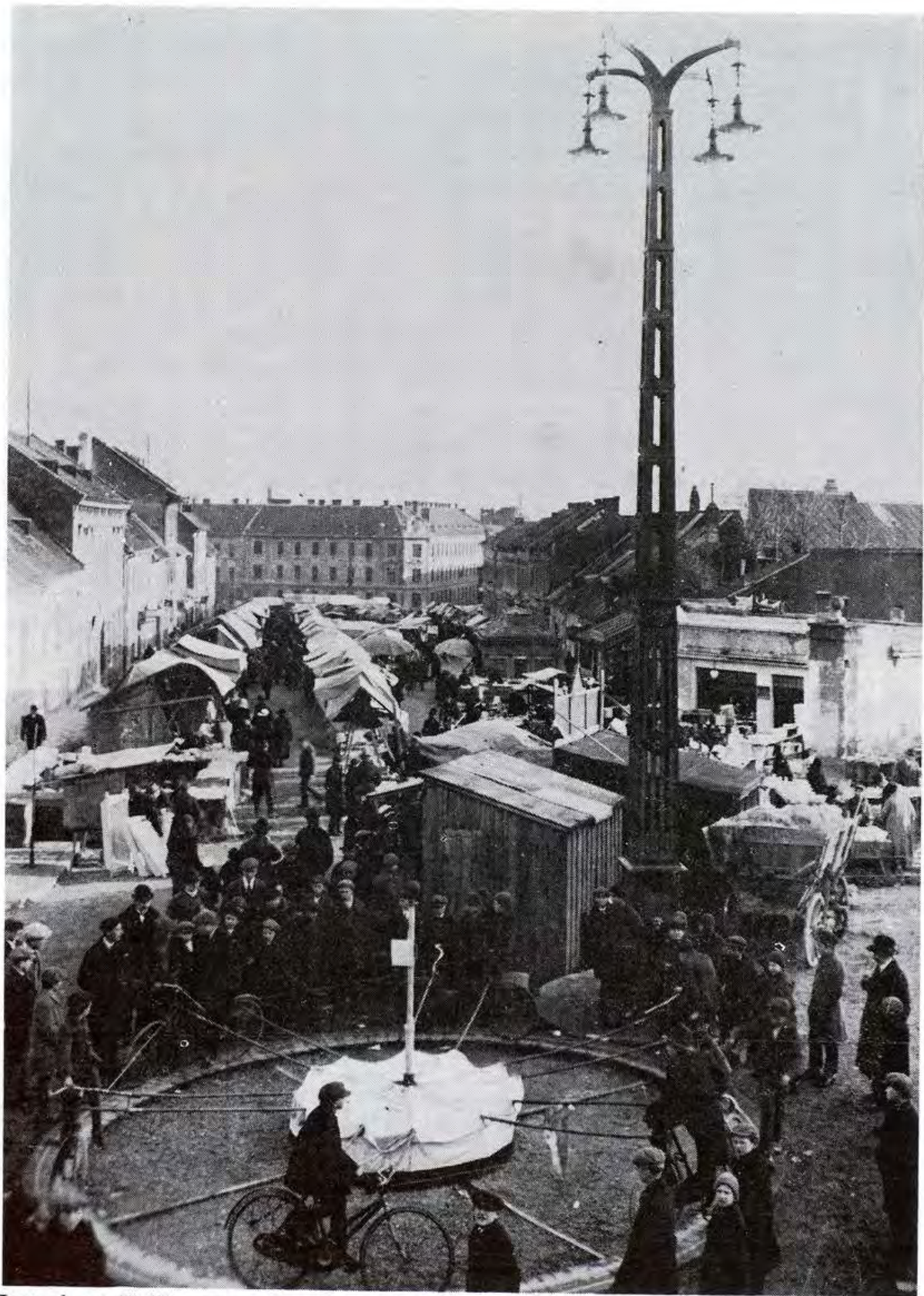
Jarmok na Kollárovom námestí v r. 1927.