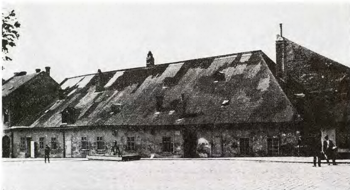
Verejná váha na Obilnom, dnešnom Kollárovom námestí z r. 1925. AMB. Foto J. Hofer. Repro E. Šišková

mia. Už v r. 1926 zaznamenávame založenie sekcie obchodníkov s miešaným tovarom a súčasne ďalšej, združujúcej obchodníkov s potravinami na trhu. O rok neskôr, v r. 1927, sa datuje vznik sekcie trhovníkov s mimopotravínovými článkami a v tom istom roku dvoch ďalších — v poradí štvrtej najpočetnejšej skupiny obchodníkov, obchodníkov s textilným, módnym a konfekčným tovarom a obchodníkov s mliekom a mliečnymi výrobkami. V nasledujúcom období, v rozpätí rokov 1929—1938 vznikajú postupne sekcie obchodníkov s drogistickým tovarom, farbami a chemikáliami, združenie obchodníkov s lahôdkami. Samostatnú sekciu tvorili tiež obchodníci s palivom. Organizačná štruktúra sa rozširuje o sekciu, v ktorej sa spojili knihkupci, nakladatelia, obchodníci s kancelárskymi potrebami, papierom a kancelárskymi strojmi, o sekciu sprostredkovateľov realít, a posledné dve sekcie: obchodníkov so železom a veľkoobchodníkov — dovozcov koloniálneho tovaru, potravín a južných plodín. 8