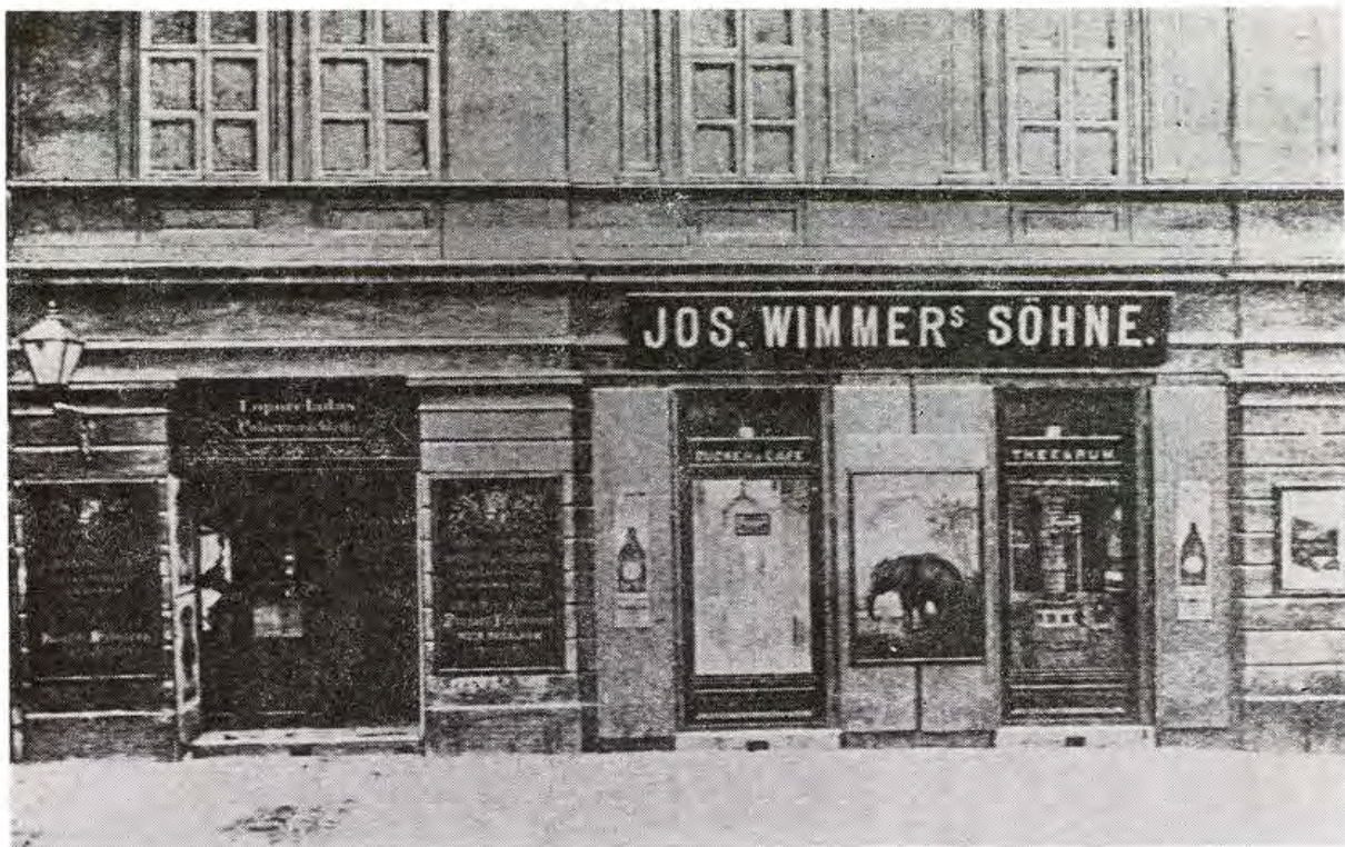
Úprava fasády domu s obchodom s koloniálnym tovarom na Michalskej ulici v medzivojnovom období.

členov o výsledkoch svojho pôsobenia prostredníctvom časopisu Der slovakische Kaufmann , ktorý pod týmto názvom vychádzal v r. 1928—1932. 12 Na stránkach časopisu uverejňovala svoje príspevky i sekcia obchodníkov s miešaným tovarom.