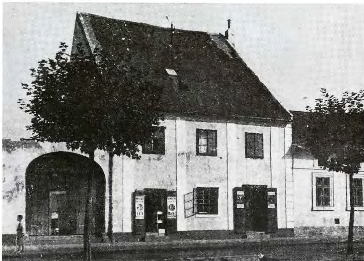
Obchody na Krížnej ulici (dnešná Steinerova) zač. 20. storočia. Dobová fotografia. Repro O. Šilingerová

k nim i predaj ďalších obchodných artiklov, najčastejšie hydiny, vajec, cukroviniek, pečiva, mlieka a mliečnych výrobkov. V rámci mestských častí sa sústreďovali na obchod s ovocím a zeleninou napr. obyvatelia Záhradníckej ulice, ale i Podhradskej ulice a Vydrice. Z hľadiska účasti obyvateľov na trhovom predaji sú zachytené i ďalšie štvrte Bratislavy, vyznačujúce sa špecifickými podmienkami demografického, a najmä zamestnaneckého vývoja. Máme na mysli napr. robotnícku kolóniu Dornkappel, v ktorej si podľa východiskových údajov účasť obyvateľstva zaobstarávala obživu trhovníctvom, najmä predajom potravín, hydiny a vajec a predstavovala v tomto smere špecializovanú skupinu. V obdobných podmienkach sa vyvinula trhovná forma predaja týchto artiklov ako zdroj obživy v rodinách na Továrenskej ulici. Radili sa tak