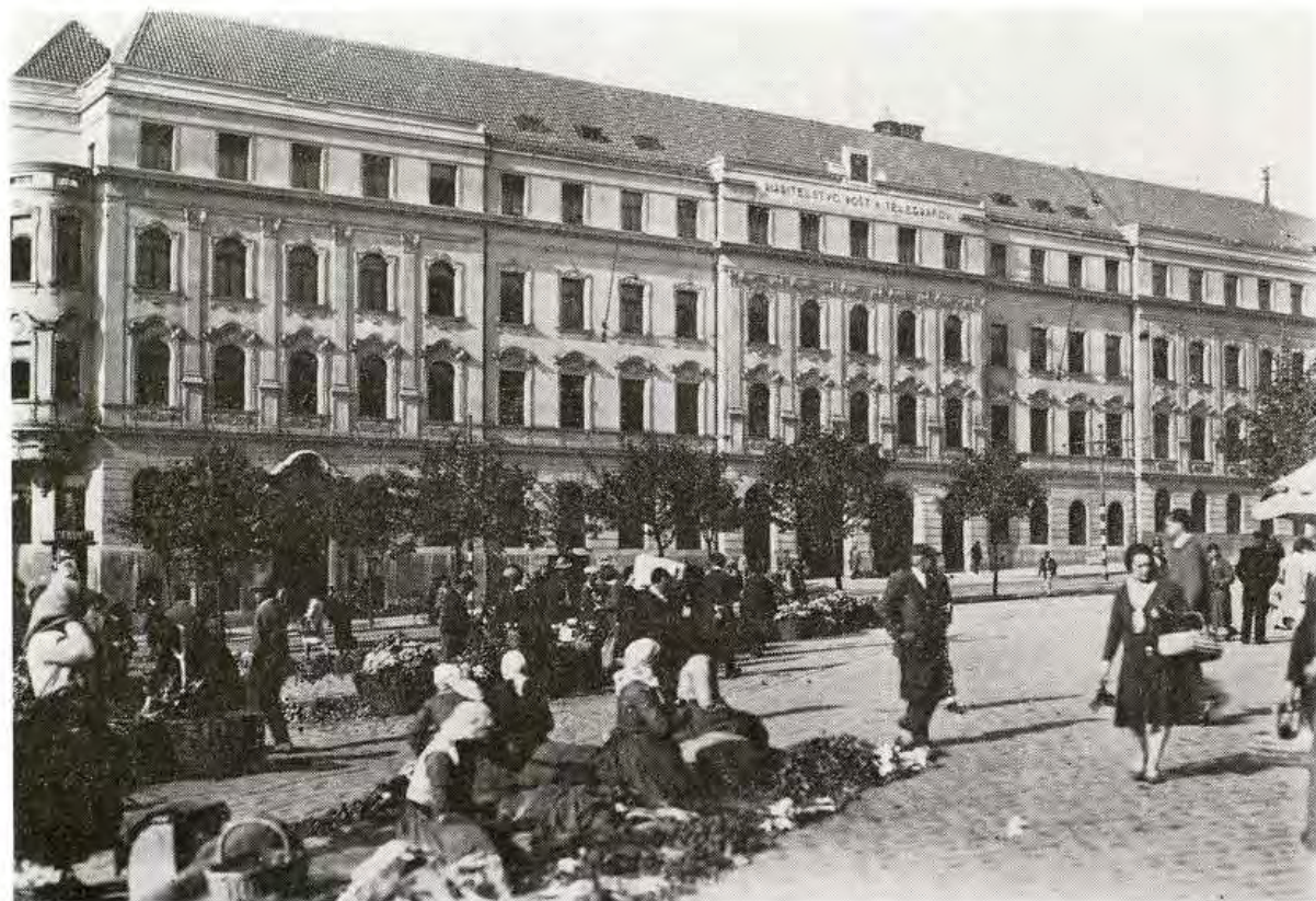
Trh na Októbrovom námestí v r. 1934.

vo väčšom meradle nepredávali. Predovšetkým ide o zariadenia pre domácnosť, fotoaparáty, výrobky elektropriemyslu, kozmetiku a pod. 5 Na rozmach obchodníctva v Bratislave v medzivojnovom období môžeme poukázať i prostredníctvom údajov týkajúcich sa rozvoja obchodnej siete. Podľa štatistik mala Bratislava v r. 1918 asi 450 obchodov rôzneho typu. V roku 1930 je to už 2655 obchodov, z toho 2187 (82 %) maloobchodov, 244 veľkoobchodov (9 %) a 224 (8 %) obchodov s veľkopredajom a malopredajom. 6 Rast príslušníkov obchodných povolání dokumentujú obdobné údaje o členstve v spolku Grémium bratislavských obchodníkov . Toto malo v r. 1930 3262 členov a v r. 1933 už 4292 členov. O niečo neskôr, v r. 1935 sa v Grémiu združovalo až 4823 členov. Okrem obchodníkov jednotlivcov, ktorí tvorili 96 % (4618 osôb) členstva, 7 išlo v ďalších prípadoch o firemné formy